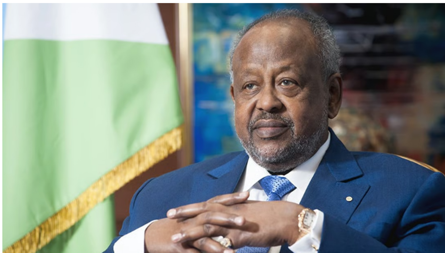
Ismael Omar Guelleh

Après avoir longtemps entretenu le suspense, et à quelques semaines du scrutin, Guelleh a officialisé sa candidature à un sixième mandat . Une annonce majeure qui n'a pourtant pas été faite dans les colonnes de La Nation , unique organe de presse national. Les Djiboutiens n'auront pas eu la primeur de cette déclaration. Le choix s'est porté sur Jeune Afrique , tribune désormais familière des djiboutiens et réputé pour polir le récit des dirigeants africains à longévité éprouvée. Le signal est clair. Le message prioritaire ne s'adresse pas au corps électoral, mais à l'environnement régional, diplomatique et financier qui observe le pays. Dans un environnement où la position stratégique de Djibouti n'est plus aussi exclusive qu'hier, il s'agissait d'abord de rassurer. D'afficher la continuité comme garantie. De signifier que, malgré les tensions régionales et les mutations en cours, la ligne restera la même .